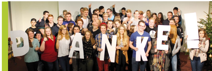
DANKE sagt stellvertretend der EC Frankenberg

Am Anfang des neuen Jahres geben wir Euch und Ihnen gern wieder Einblick in unsere Pläne und Vorhaben. Auch ein Rückblick auf unsere Arbeit im Knüll House und in der EC-Kinder- und Jugendarbeit seit dem Sommer ist dran. Uns ist wichtig, gut über unsere Arbeit und Anliegen zu informieren, damit Ihr und Sie gezielt für uns eintreten, beten und uns nach Euren/Ihren Möglichkeiten unterstützen könnt/können. Dazu berichten unsere hauptamtlichen Mitarbeiter aus ihren Arbeitsfeldern.