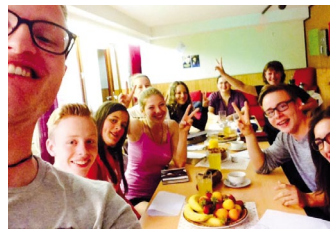
Mitarbeiterschulung in Eschwege