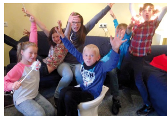
V.I.P. Lounge In Bad Hersfeld