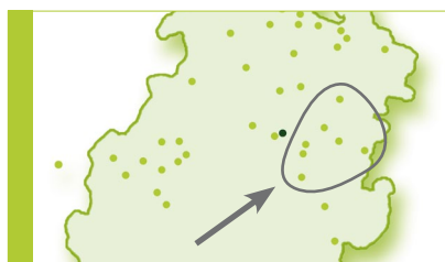
Der Kreisverband Osthessen