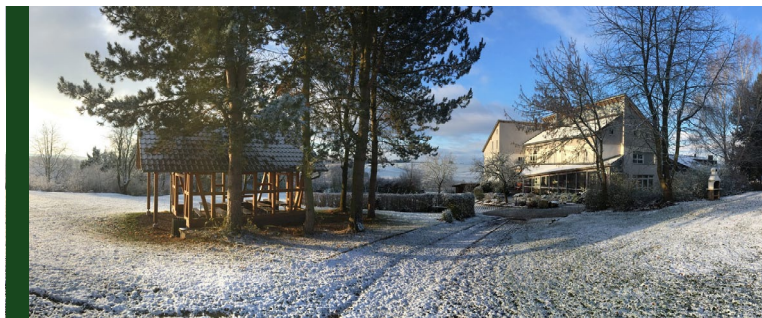
Winterzauber rund ums Knüll House

Im letzten Jahr hatten wir aufgrund von beruflichen Veränderungen viele Wechsel in unserem Team. Durch Neueinstellungen und Umwandlung von Minijobs in Midijobs konnten wir das bisher kompensieren. Ehemalige Mitarbeiterinnen stehen weiter für kurzfristige Einsätze zu Verfügung. Dennoch werden wir auch in diesem Jahr wieder neues Personal einstellen müssen.