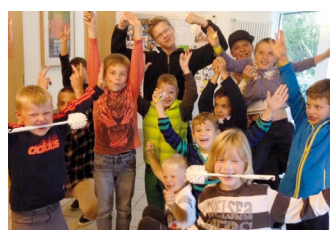
J-Kids in Neukirchen

Es war eine Pracht zu sehen, wie sich die Kinder zuerst von ganzem Herzen ekelten, beinahe der Herpes Einzug an den Lippen hielt, und dann zu erleben, wie Kinderaugen zu leuchten begannen, wenn sie eine Toilette voller Süßigkeiten („Das Schnuckelklo“) vorfanden. Wir hatten das Privileg, anwesend sein zu dürfen, wenn die Kinder dabei einen Gott erlebten, der auch aus scheinbar „unschönen“, „unsauberen“ Momenten und Situationen im Alltag „süße und heilsame“ Dinge entstehen lassen kann. Egal, ob Bad Hersfeld oder Frankfurt Niederrad: Überall sind wir mit den Kids diesem Gott auf der Spur.